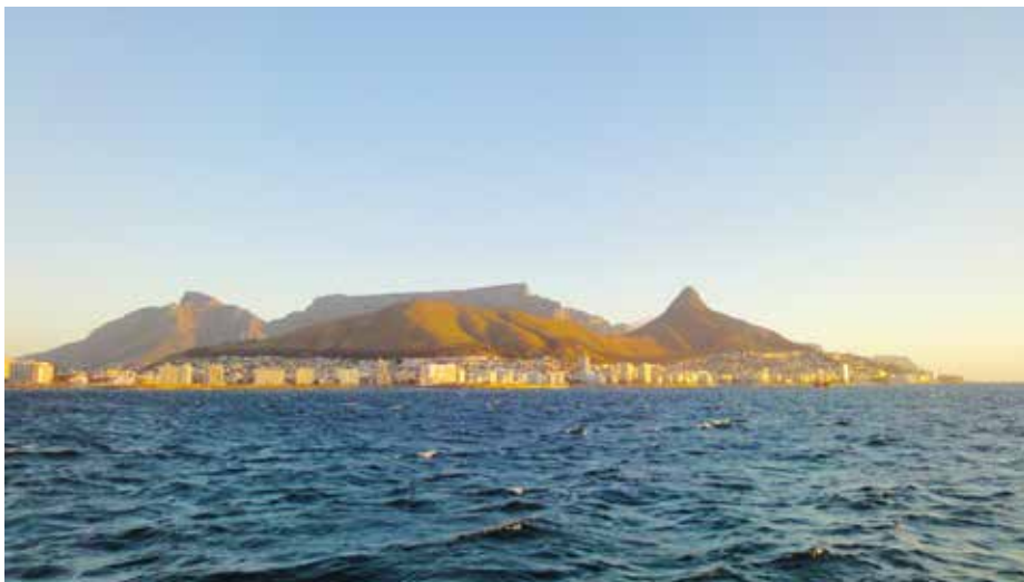
Sør-Afrika er et av områdene i verden med prosentvis raskest økonomisk vekst, og kunnskap om dette laksemarkedet er derfor av verdi for bedrifter som ønsker å satse i andre områder i denne regionen. Her er fra Cape Town – den lovgivende hovedstad i landet og den tredje største med ca 3 millioner innbyggere.