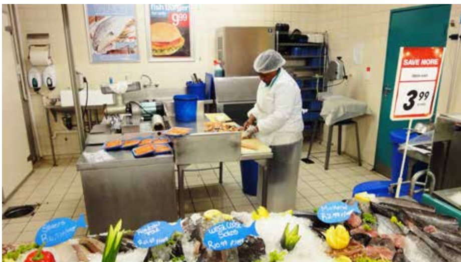
På grunn av at importørene også fungerer som grossister finnes det ikke mange rene grossister som selger uforedlet laks i Sør-Afrika. Grossistene er ofte små bedrifter som selger små volum av ubearbeidede eller bearbeidede produkter.